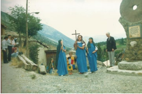
Assaig de la representació de l'obra "Arnaldeta de Caboet", a Cabó, 1986.

ser redactor en cap del Diari de Mataró . Treballa a la seu d'Estat Català i fa de secretari de Joan Torres-Picart, que n'és secretari general.