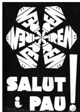
Emblema de "Salut i pau!", moviment ecologista creat per Esteve Albert el 1978