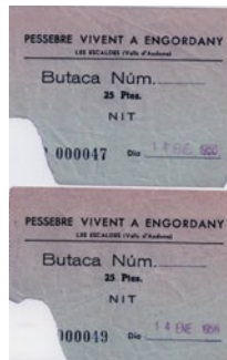
Entrades del Pessebre Vivent a Engordany del 14 de gener 1956.